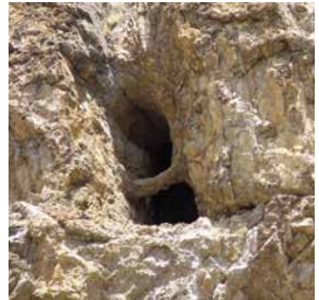
Copper Mine Cave Narphu

When asked about the feasibility of canyoning in Nepal, Maurice opined