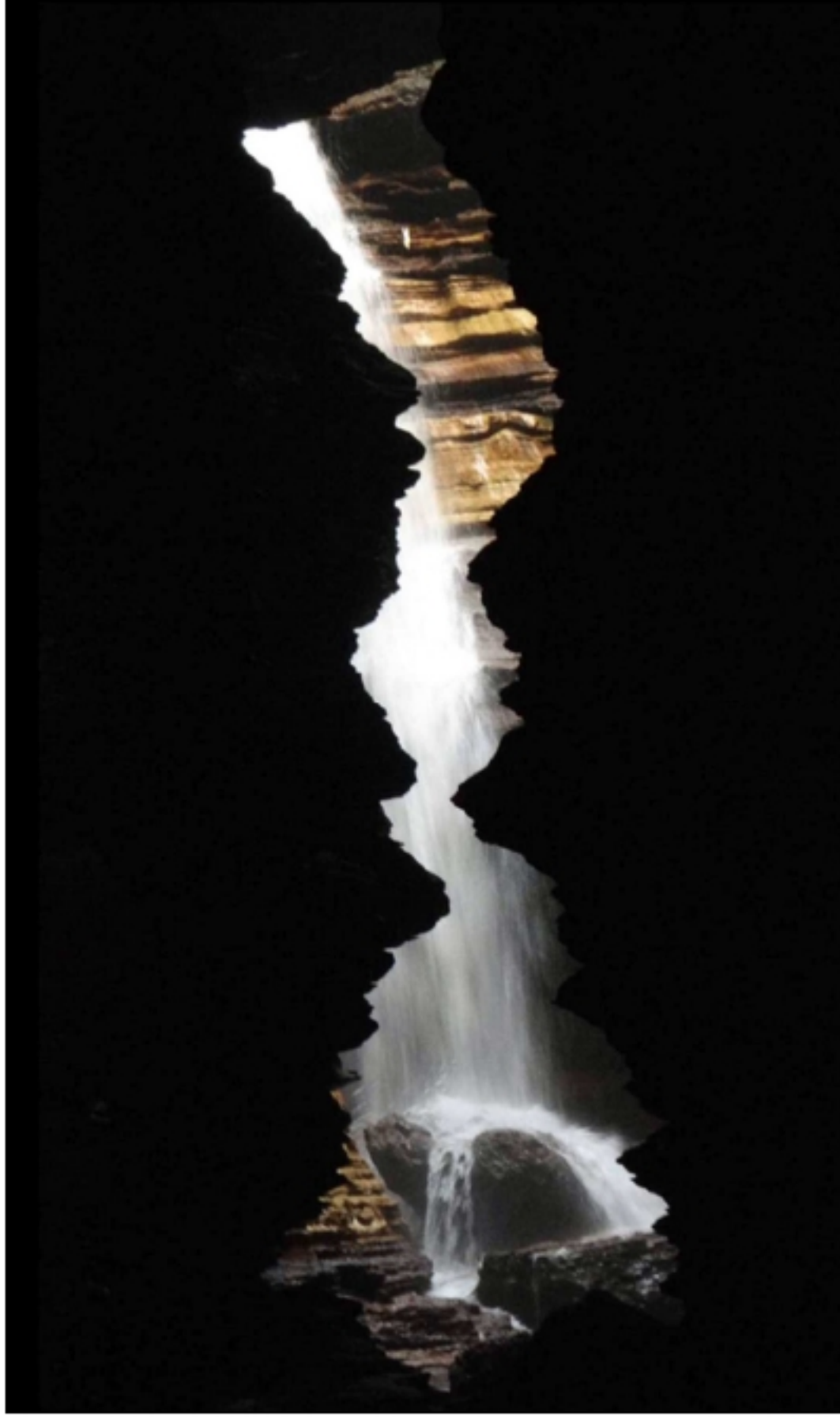
Vue à -50, dans Gupha Mahadev, près de Pokhara.

Maurice DUCHENE. 4 rue du Caillet 31390 Carbonne, Tel. 0675210025, mauduchene@gmail.com