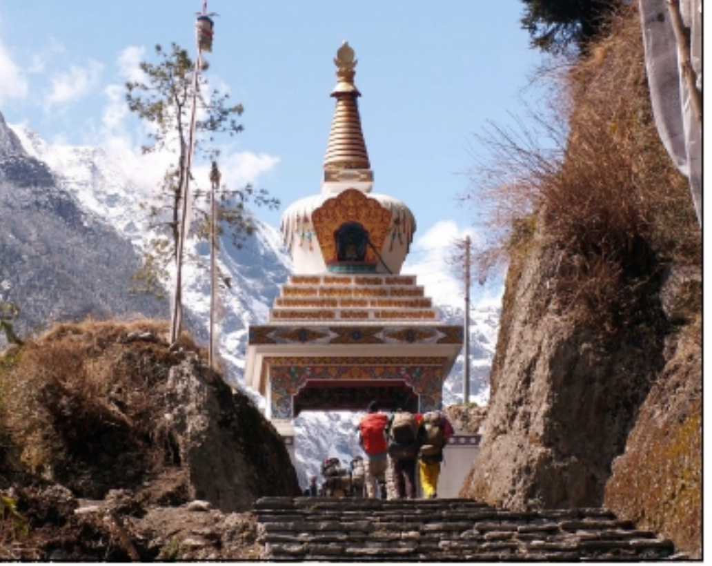
Le Népal offre partout des monuments religieux dans des sites grandioses

m.baille@orange.fr Prendra effet au n° 40. Merci pour votre réponse.