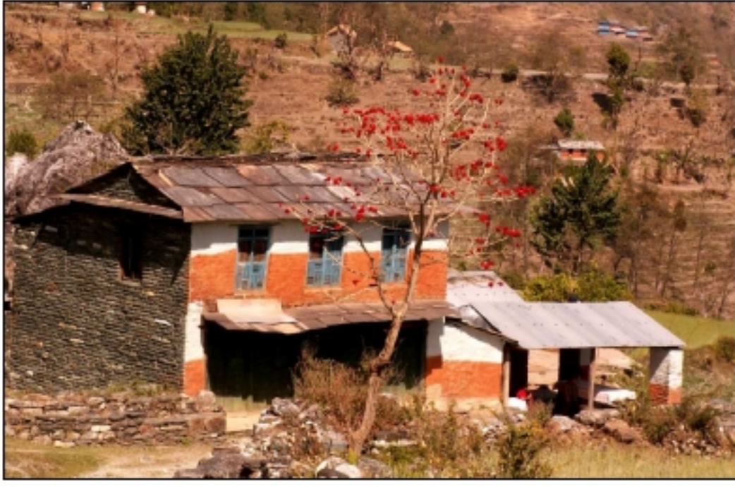
Cette jolie maison, croisée au détour d'un chemin en 2006, a-t-elle échappé au tremblement de terre ?

par internet, plutôt que sur support papier, le précisent à notre trésorier :