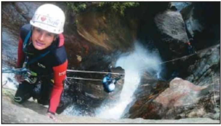
जोखिम - ठमली टाढा

पाँच सप्टेम्बर पाँच हजार दुई सय मिटरको उचाइमा क्यानोनिङ गर्न सकिन्छ। तैपनि क्यानोनिङ गर्न प्रतिस्पर्धाका लागि, टोपोम्याप, समय, ट्रेनिङको राम्रो ज्ञान हुनुपर्ने संकेत प्राकृतिक कविन्द्र बताउँछन्। त्यसको पूर्वगामी, क्यानोनिङको भूगोल बनेको बेला पनि जनशक्ति हुनुपर्छ। क्यानोनिङमा बढी क्यानोनिङ साइडलाई