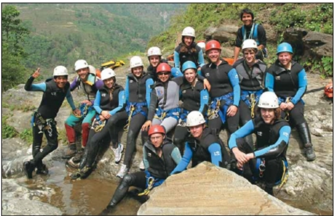
जोखिम - ठमली टाढा

क्यानोनिङको विकाससँगै सन् २००७ मा नेपालको पर्यटन व्यवसायीको अनुबन्धमा नेपाल क्यानोनिङ एसोसिएसन स्थापना भएको हो। यस संस्थाले सन् २००८ मा फाल्गुन महिनामा दक्ष जनशक्ति उत्पादनका लागि फ्रान्सको क्यानोनिङ स्कुल, नेपालका प्राकृतिक नेपाल पर्यटन बोर्ड, नेपाल पर्वतारोहण एसोसिएसन संघ मिलेर नेपाली युवालाई १५ दिनको आधारभूत जालिम