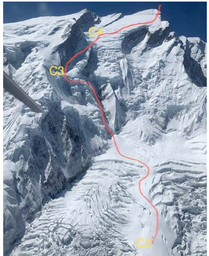
La voie 2021 Annapurna